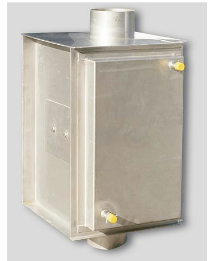
Beispiel HEAT KEEPER

Die Einbausituation des HEAT KEEPER muss vor dem Einbau vom Bauherrn mit dem zuständigen Schornsteinfeger abgestimmt und geprüft werden.