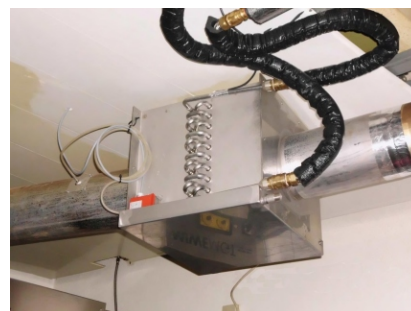
Wätas Gaskühler "Heat Keeper"