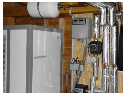
Wätas Wärmepumpe "LWZ"